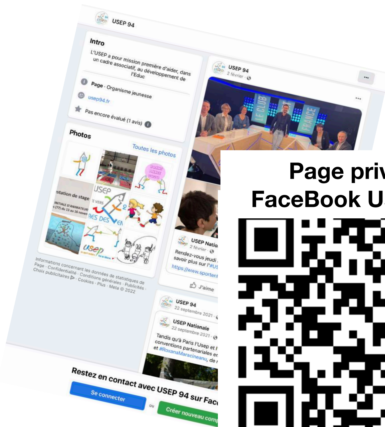
Page privée FaceBook Usep 94

Profitez de toutes les ressources mises à votre disposition par l'USEP 94 :