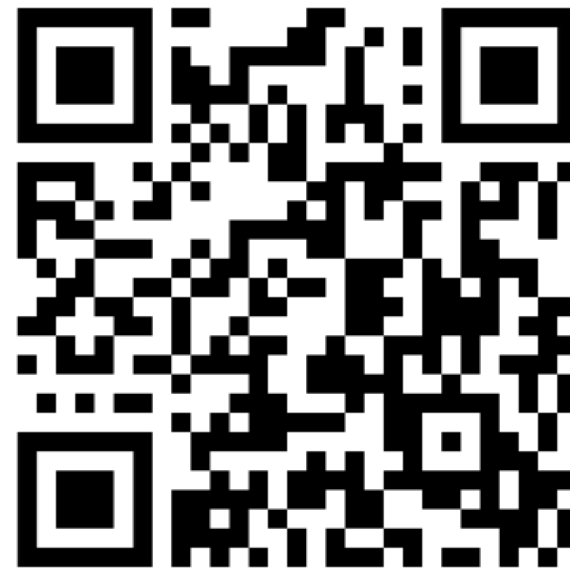
Chaine Vimeo Usep 94

Vidéos en ligne, témoignages, reportages, tutos